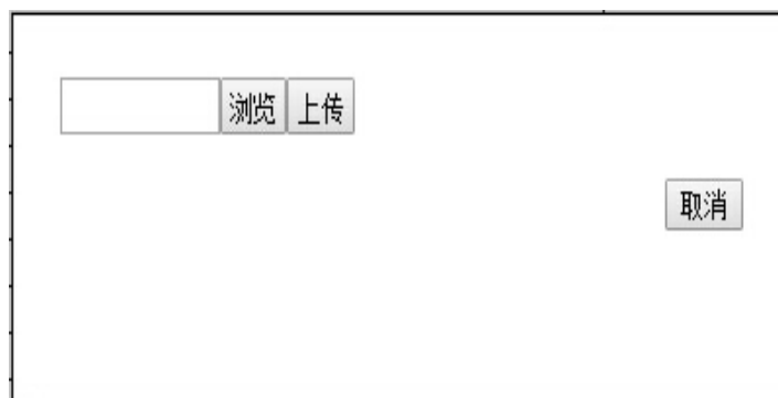
图 3.6-1 导入 EXCEL 文件的部门信息

3、点击【浏览】按钮，弹出路径选择窗口，选择符合部门信息导入模板要求的 EXCEL 文件的路径，如图 3.6-2：